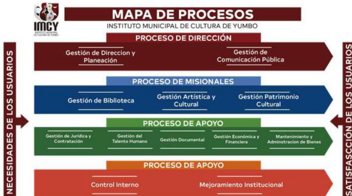
Ilustración 3: Mapa de Procesos de la Entidad