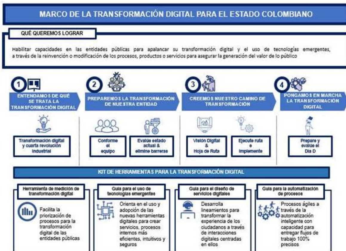
Ilustración 2: Marco de la Transformación Digital del Estado