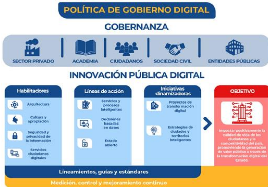
Ilustración 1: Política de Gobierno Digital